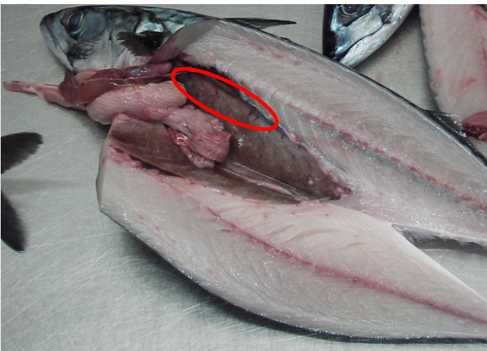
Figur 2. Prøveuttaket med svaber

Fisk (Nr1) åpnes ved bruk av saks eller kniv. Ta prøve ved å stryke med svaber (1b) på innsiden av buken til fisken (svarthinne) som vist i Figur 2. Unngå blod ved prøvetaking. Skriv fisk nummer "1" på svaber med tusj. Gjenta alle disse trinnene på 10 fisk.